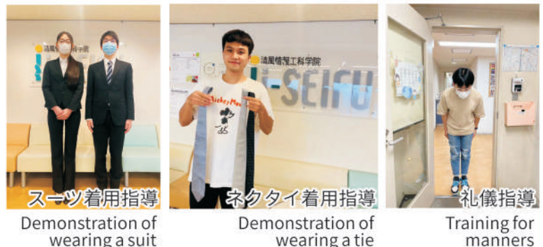
スーツ着用指導 Demonstration of wearing a suit